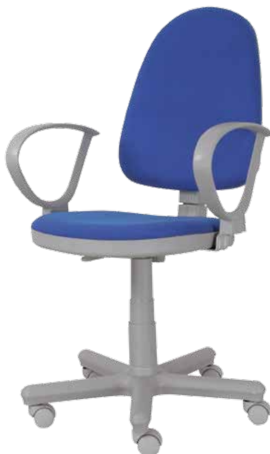
Prestige Grey gtpR