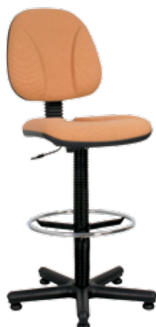
Regal gts Ring Base Ergo