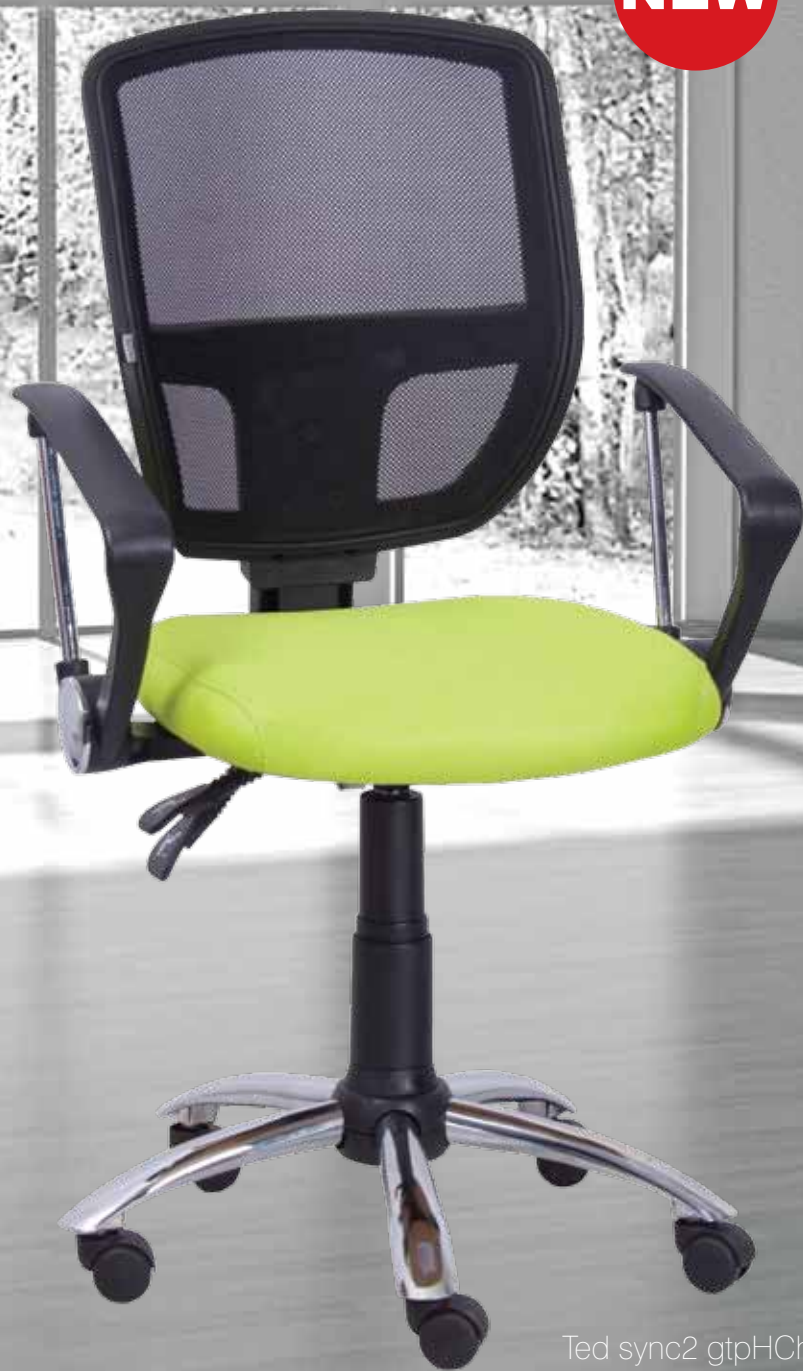
Ted sync2 gtpHCh2