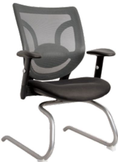
Brise cbrp55 Silver