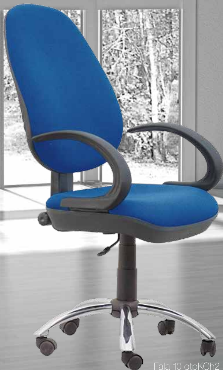
Fala 10 gtpKCh2