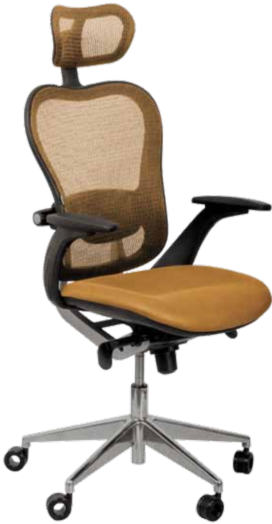
Pegas gtpAlu3 WHS