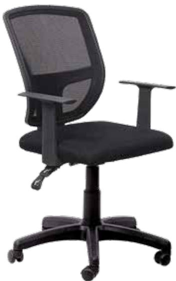
Ted sync2 gtpTN7