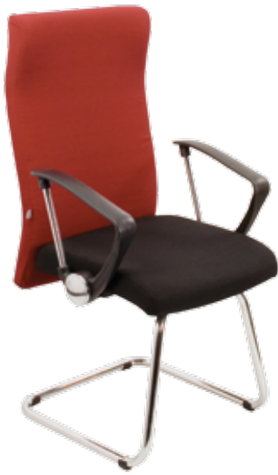
Gamma cfpH Chrome