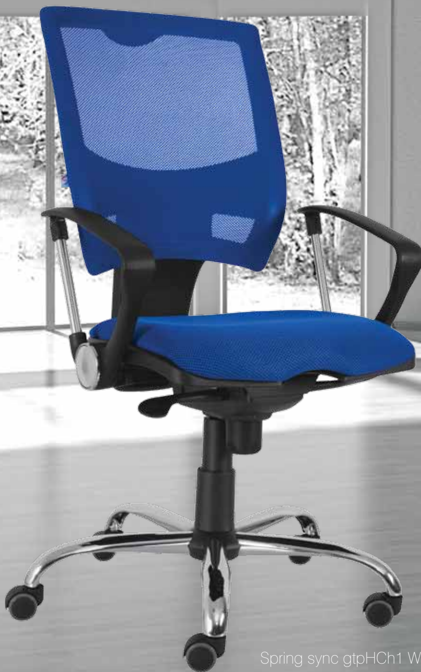
Spring sync gtpHCh1 WRS