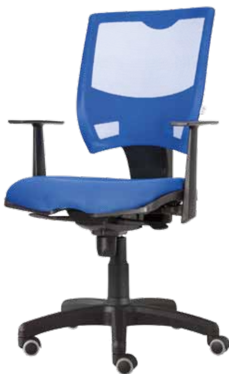
Spring sync gtpTN7 WRS