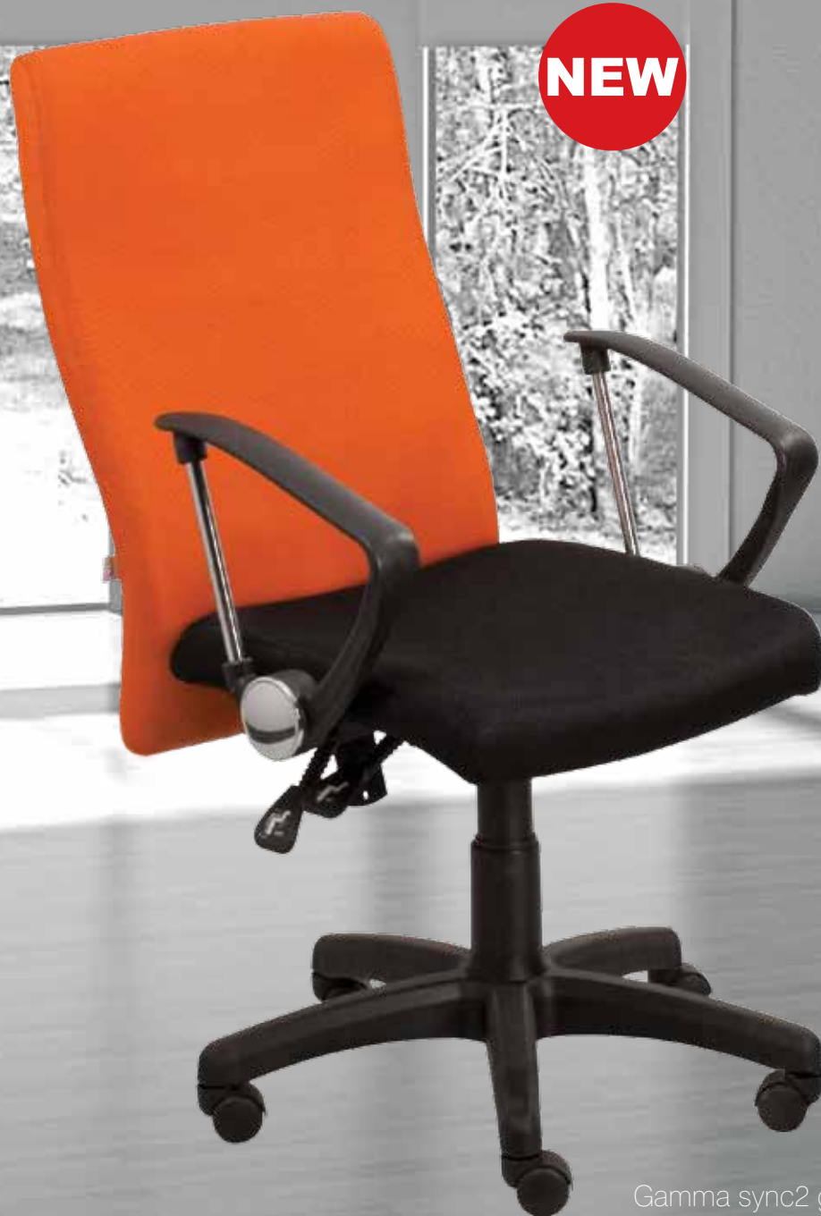
Gamma sync2 gtpHN7