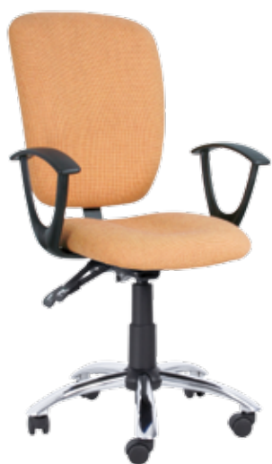
Meridia sync2 gtpSCh2