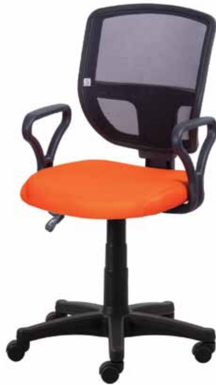
Ted sync2 gtpPN3