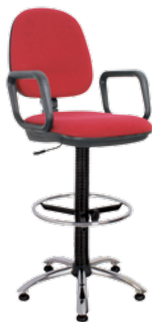
Metro gtpUCh2 Ring Base