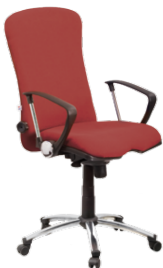
Dakar sync gtpHCh4 BS