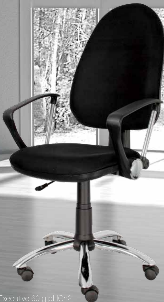
Executive 60 gtpHCh2