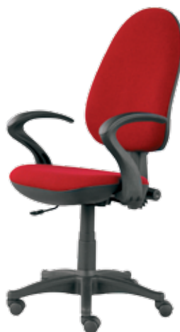
Executive 60 gtpEN