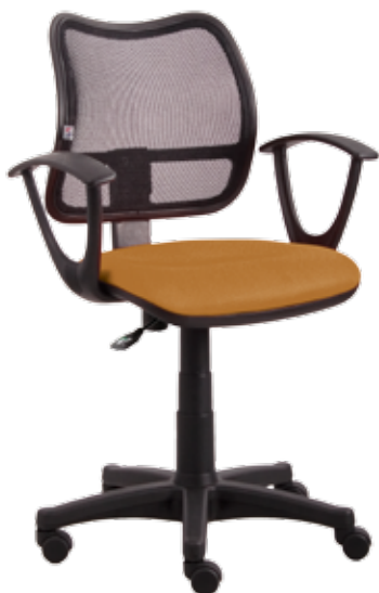
Net sys gtpSN3