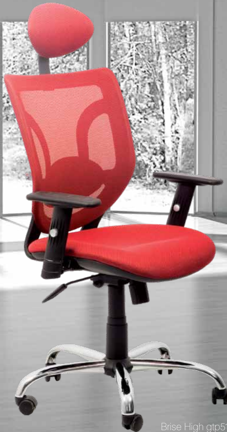
Brise High gtp51Ch1