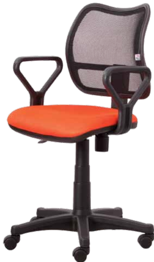
Net sys gtpPN3