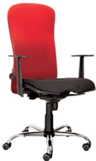
Dakar sync gtpTCh1 BS WRS-S