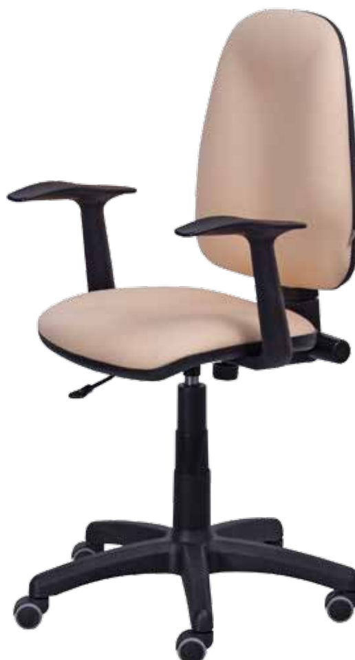
Pluton gtpVN7 WRS