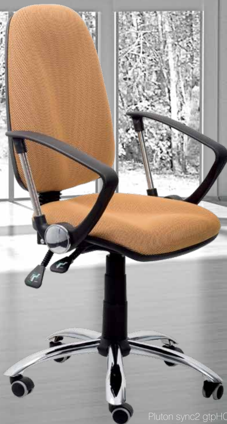
Pluton sync2 gtpHCh2 WRS-S