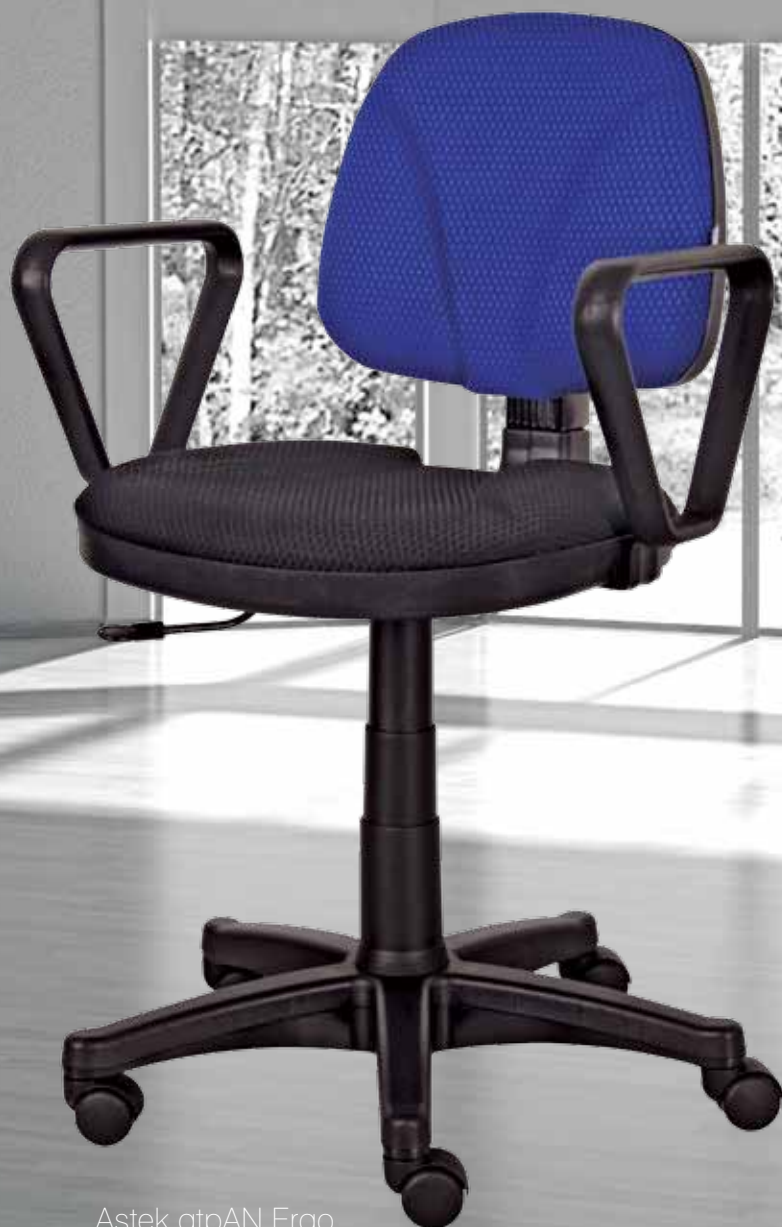
Astek gtpAN Ergo