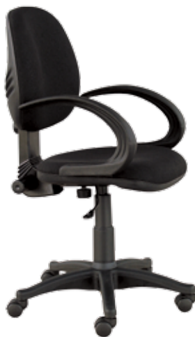
Fala 08 gtpKN