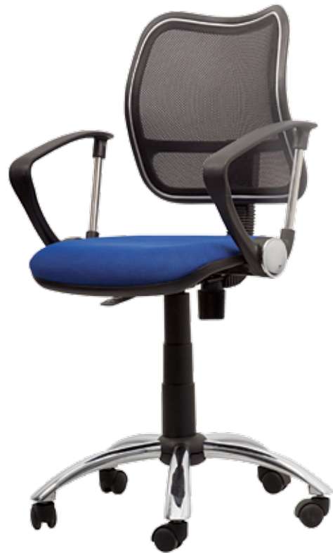
Net sys gtpHCh2