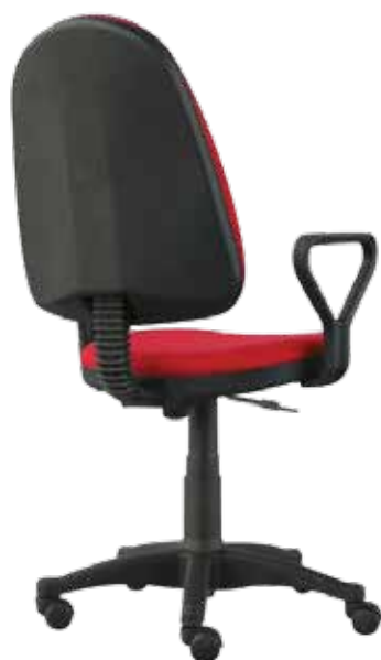
Prestige E gtpMN