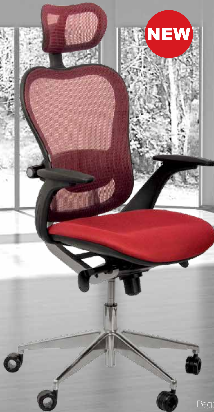
Pegas gtpAlu3 WHS