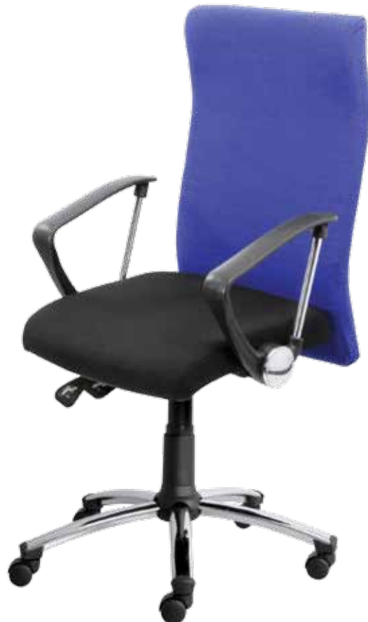
Gamma sync2 gtpHCh4