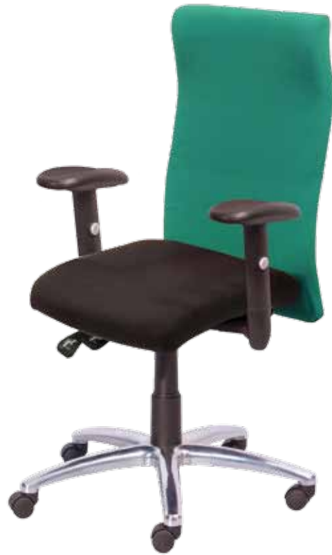
Gamma sync2 gtp55 Alu1