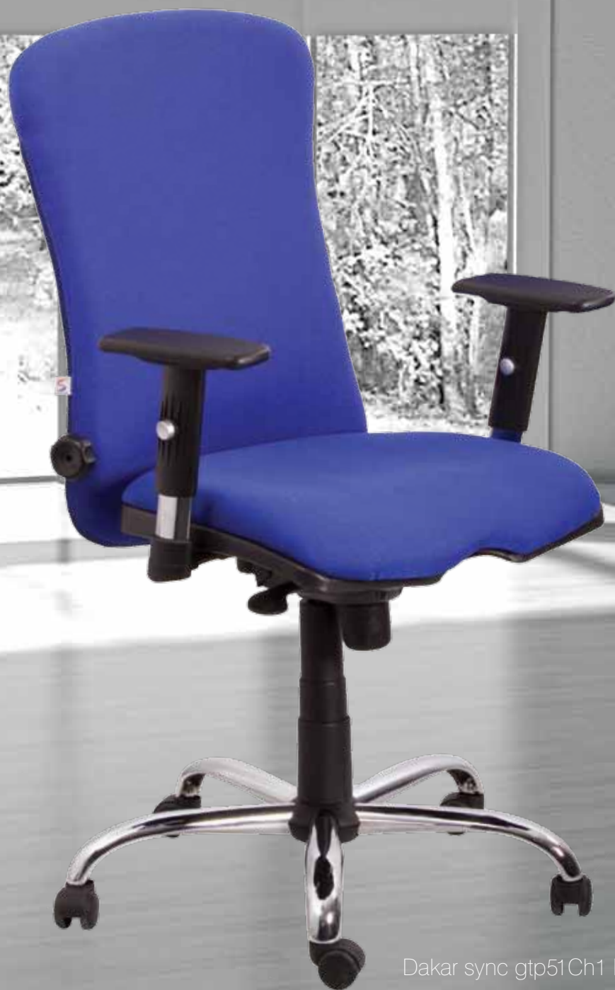
Dakar sync gtp51Ch1 BS