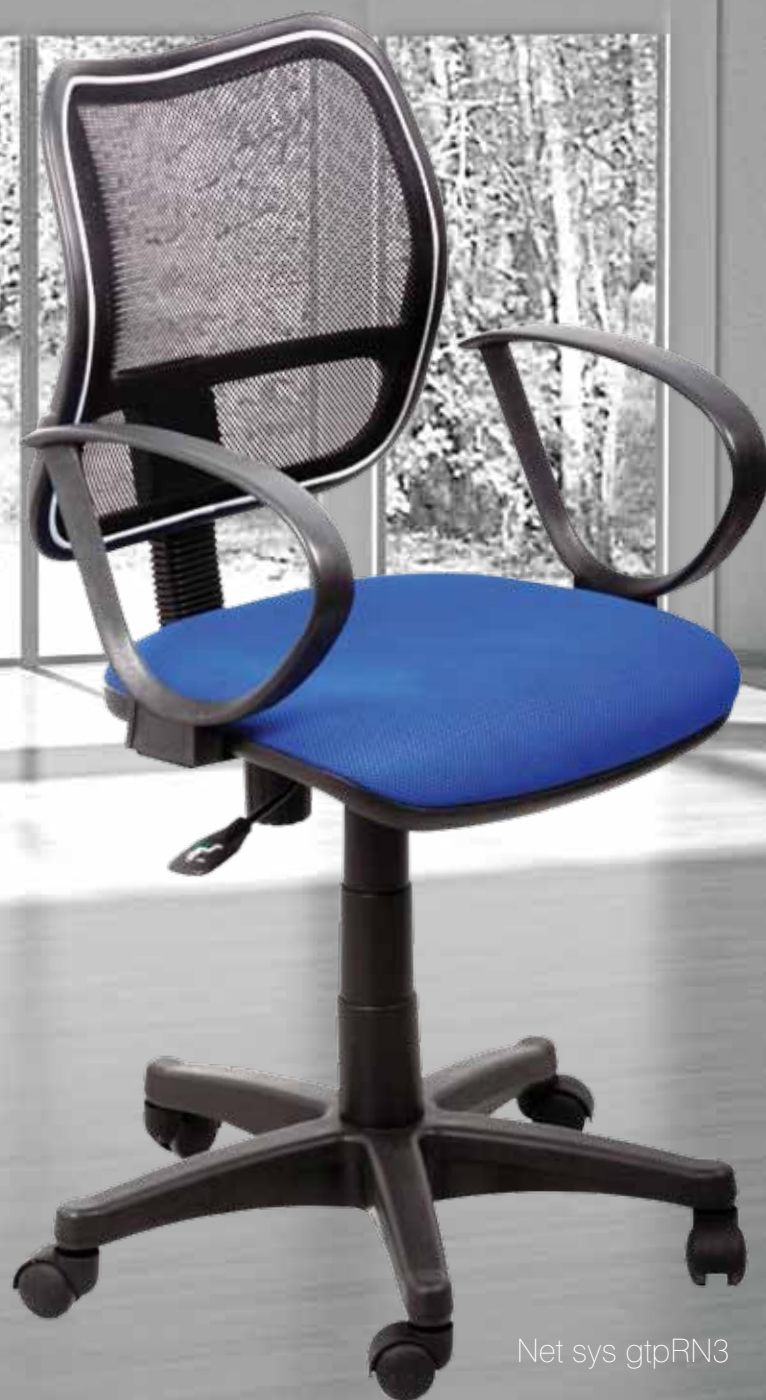
Net sys gtpRN3