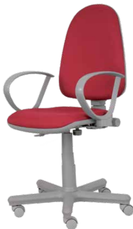
Prestige Lux Grey gtpR