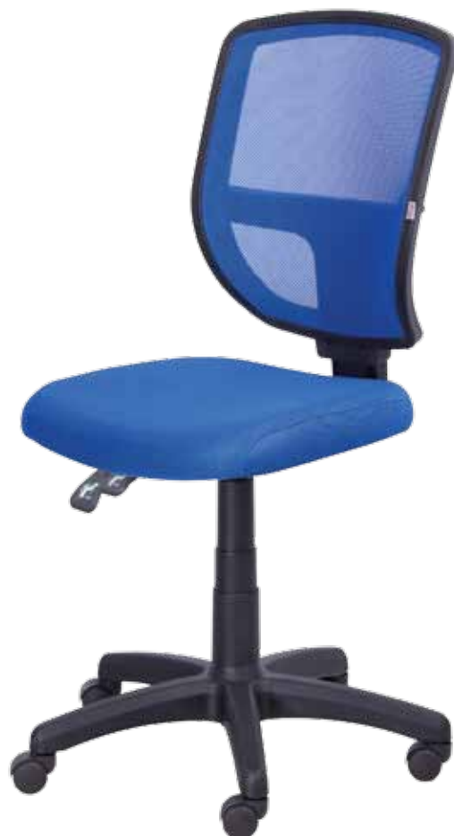
Ted sync2 gtsN7