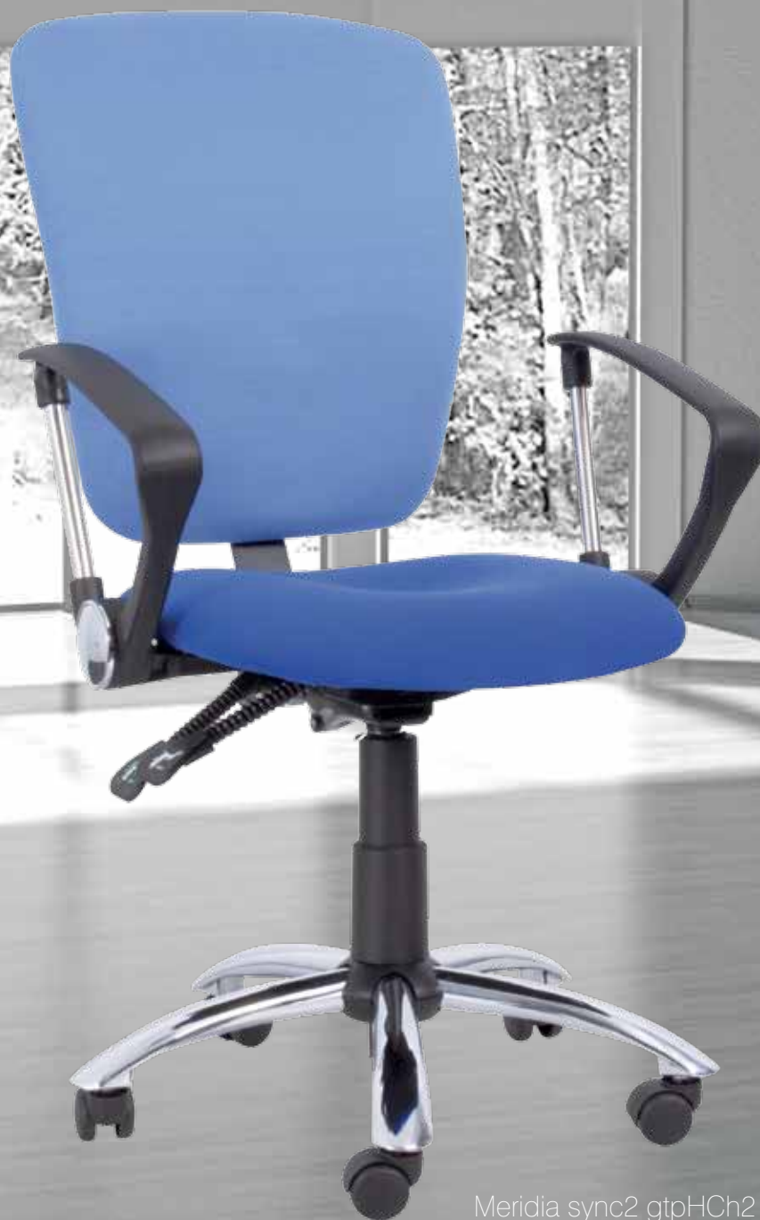
Meridia sync2 gtpHCh2