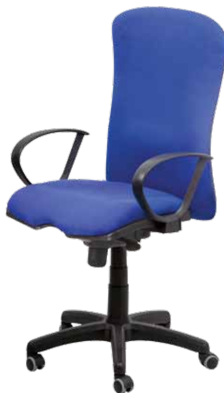
Dakar sync gtpRN7 WRS-S