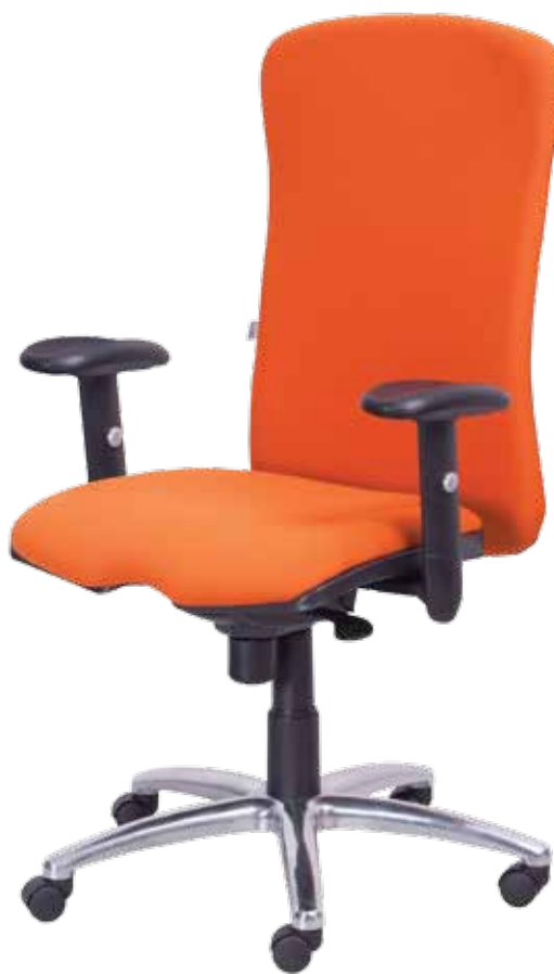
Dakar sync gtp55Alu1