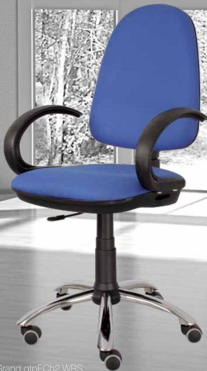
Grand gtpFCh2 WRS