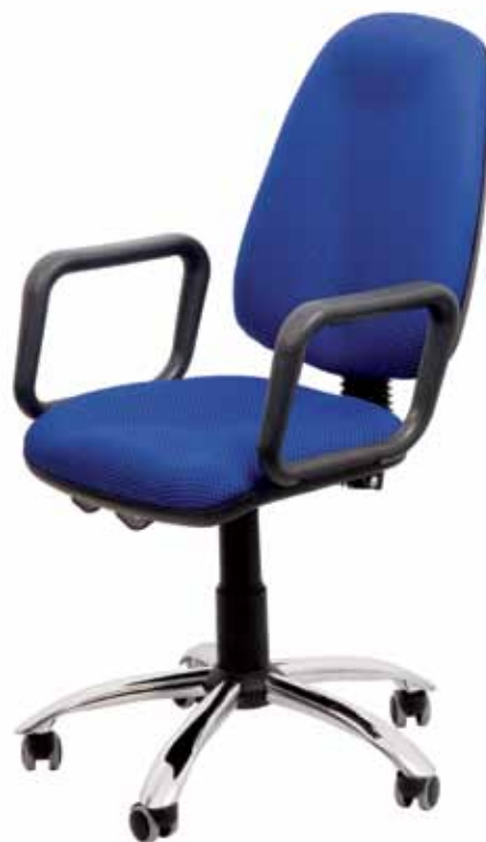
Pluton sync2 gtpLCh2 WRS