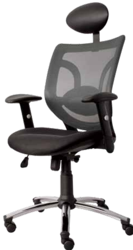
Brise High gtp55Ch4