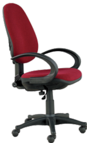
Fala 09 gtpFN