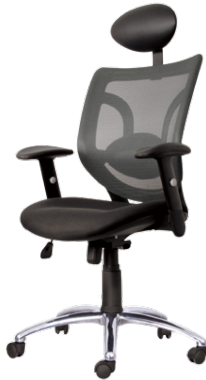
Brise High gtp55Alu1