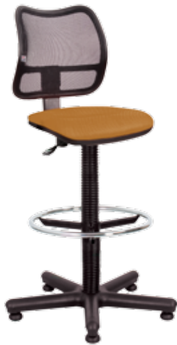
Net gts Ring Base