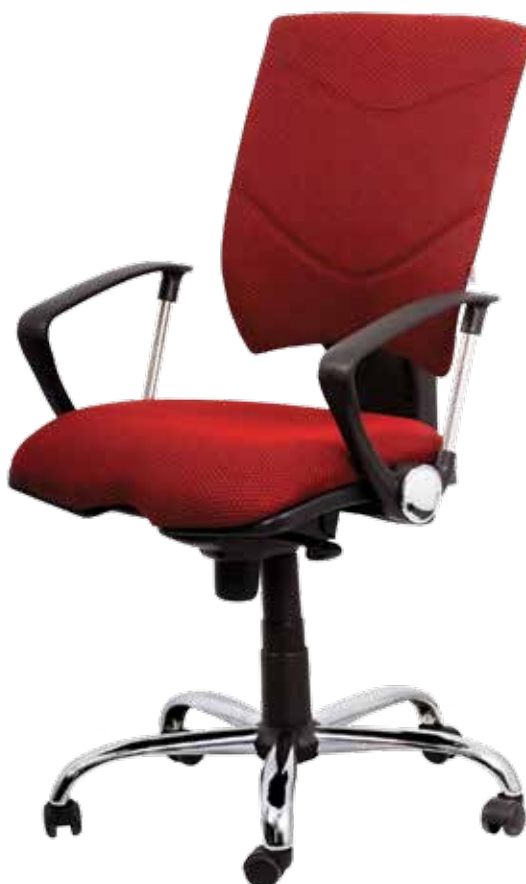
Spring Lux sync gtpHCh1