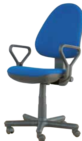
Executive 50 gtpP