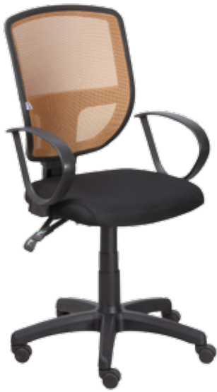
Ted sync2 gtpRN7