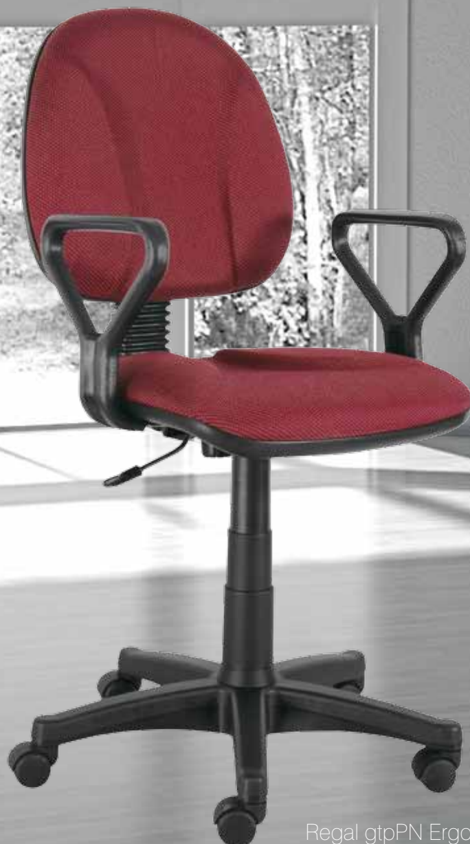
Regal gtpPN Ergo