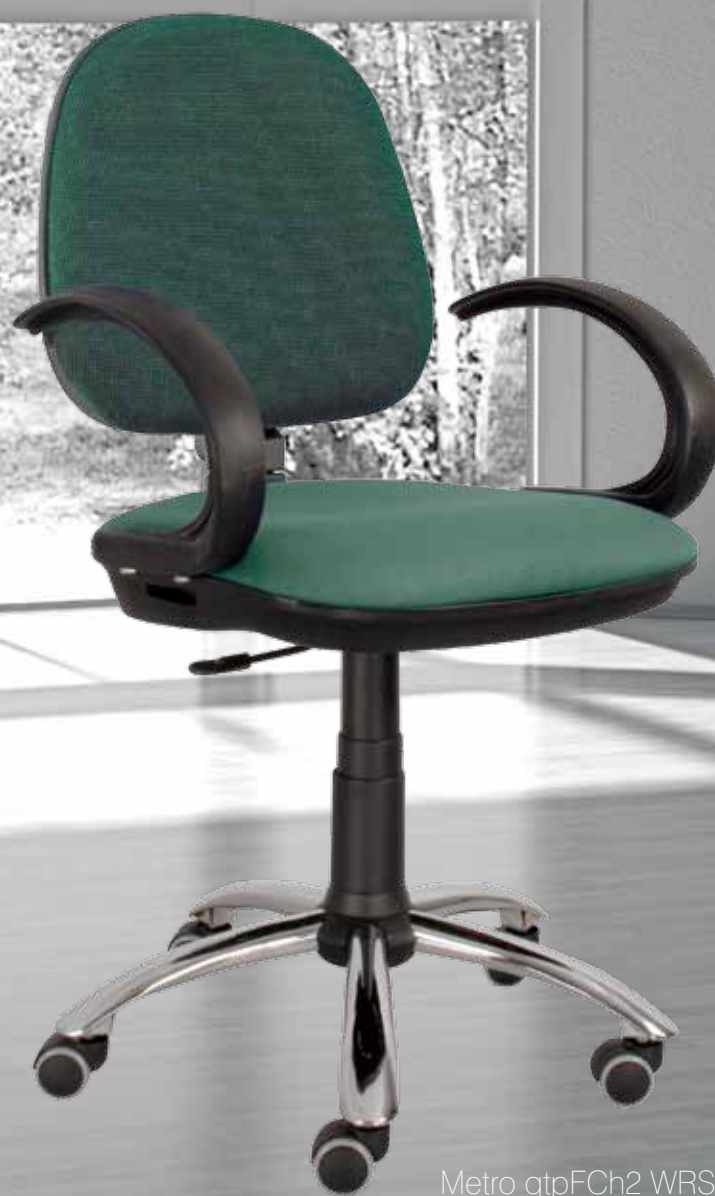
Metro gtpFCh2 WRS