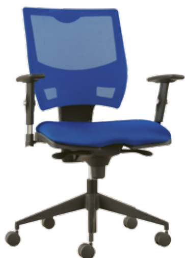
Spring sync gtp51Z