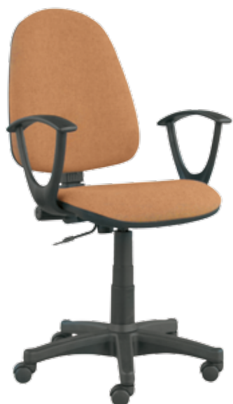
Prestige Lux gtpSN